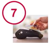
Gestion des paiements